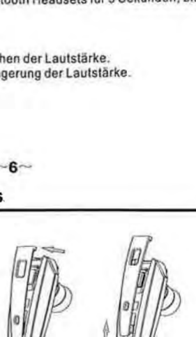
Fig.C: Setzen Sie den neuen Design-Clip vorsichtig an der bezeichneten Stelle des Headsets ein.

Fig.D: Drücken Sie den Design-Clip fest an.